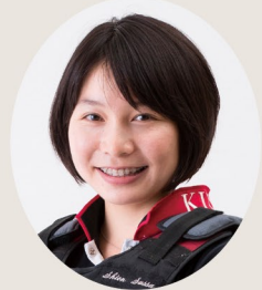
明松寺馬事公苑所属