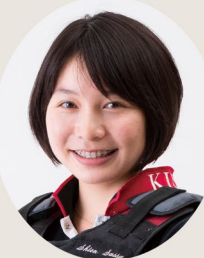
明松寺馬事公苑所属