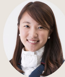
アイリッシュアラン乗馬学校所属