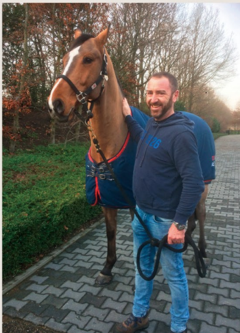
エイデンは元世界選手権金メダリストのグループさんをやっていたんです

駆け付けた彼は厩舎の電源を落とし、洪水を止め修理に取り掛かりました。その間、私は停電で水が飲めない馬たちにバケツで水を配る役。ちなみにボスはパーティーでまさに「ビールで乾杯！」というタイミングで私に呼び出されたよう…。寒い中コーヒーマシンも動かず、 “no coffee, no beer…” と切なそうにつぶやいたのは、聞かなかったことにしておきます。